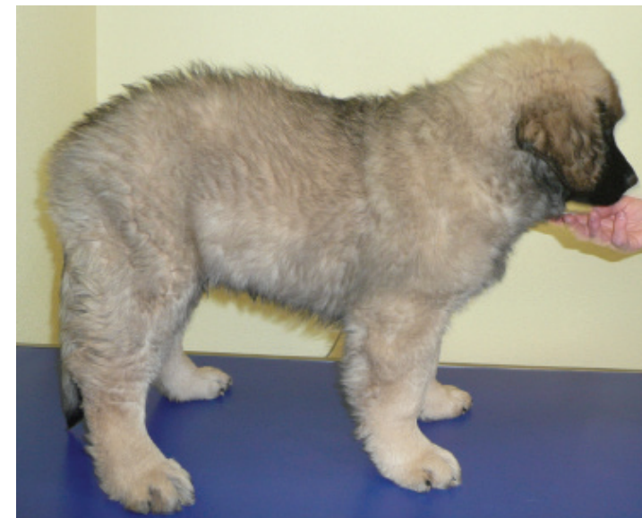
Di angelo, jeune chien avec bassin serré, dos voussé et mauvais aplombs : FTM très élevée. A gauche : Labrador avec hélice inversée qui a du mal à se coucher.

Ce stage est ouvert à tous les ostéopathes quelque soit leur exercice. Mais il n'est en aucun cas une incitation à un exercice non régulé de l'ostéopathie sur toutes les espèces. L'ostéopathe ayant le droit dans son pays d'exercer uniquement sur l'homme y trouvera une aide à avancer dans sa pratique humaine. L'ostéopathe habilité dans son pays à n'exercer que sur les animaux y trouvera une aide à avancer dans sa pratique animale.